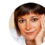
Simona Parini Ufficio Stampa